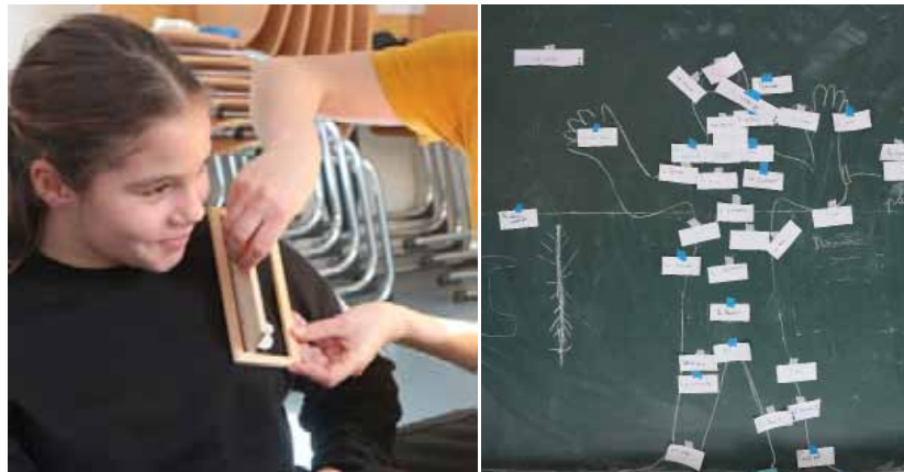
Rituels corporels avec une classe de CM2 de Schiltigheim

Pour cette nouvelle création, nous avons souhaité nous adresser à des enfants du 1 er degré en leur proposant régulièrement des Rituels corporels .